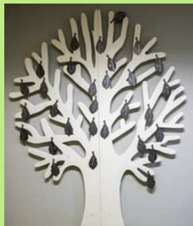
Gedenkboom overleden daklozen in Leiden - Folly Hemrica